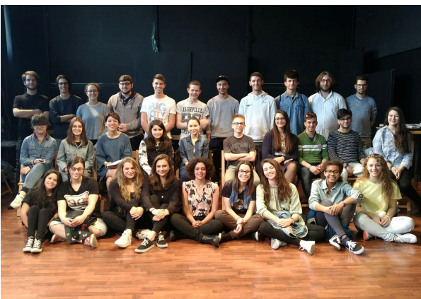
Festival 2017: la Giuria di ragazzi e ragazze

Il Festival delle Scuole è un Concorso di Teatro a cui sono ammessi, previa compilazione della domanda allegata, gruppi di teatro delle Scuole Secondarie di 2° grado . Il Concorso si svolge durante il mese di maggio e la Cerimonia di Premiazione dei vincitori si tiene domenica 27 maggio 2018 all'ITC Teatro di San Lazzaro. L'iscrizione è gratuita . Per partecipare è sufficiente, dopo aver letto il bando di concorso, compilare e firmare il modulo di iscrizione e la scheda di partecipazione allegati e inviarli con le modalità e nei tempi indicati. I gruppi partecipanti si esibiscono davanti a una giuria composta interamente da ragazzi e ragazze , provenienti da tutte le scuole in concorso, che dovranno valutare testo e recitazione, grado di difficoltà e originalità, costumi, scene e musiche degli spettacoli in gara. La giuria è senz'altro una delle cose più belle nonché il simbolo di questa rassegna dedicata ai più giovani. Al termine della manifestazione, la scuola prima classificata riceverà un premio in denaro pari a euro 1.500 , che la scuola si impegna a spendere nell'organizzazione di attività culturali destinate agli allievi, nonché il diritto a partecipare all'edizione 2019 della Manifestazione Teatro Lab organizzata dal Centro Teatrale Europeo Etoile sul territorio della Provincia di Reggio Emilia.