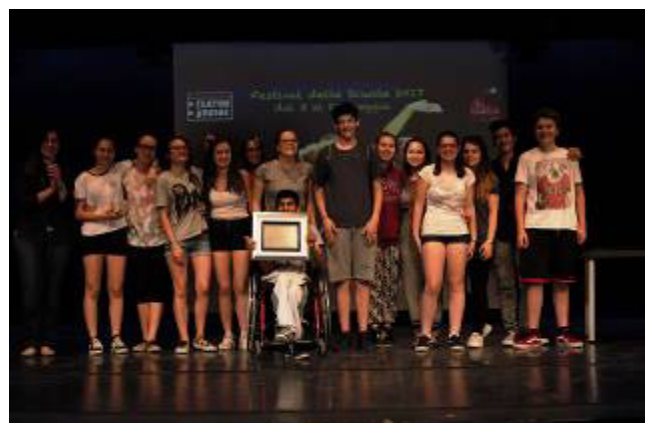
I vincitori dell'edizione 2017: Istituto Salvemini di Casalecchio di Reno