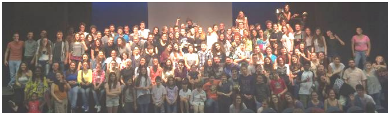
La celebrazione dei vent'anni del Festival con i partecipanti delle passate edizioni, dal 1995 al 2015

2017 - grazie all'esperienza pluri-ventennale nelle scuole, nasce Futuri Maestri , progetto dedicato a bambine, bambini e adolescenti dai 3 ai 18 anni